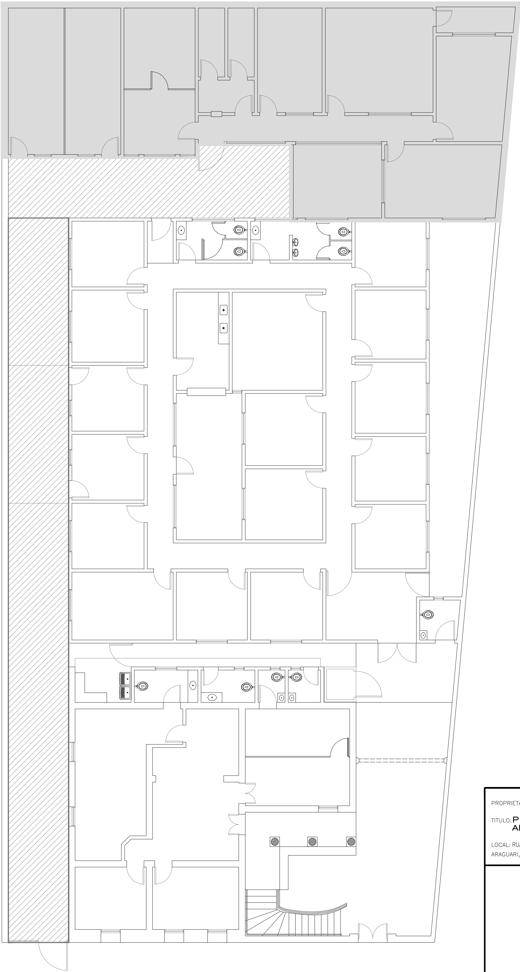
DELIMITAÇÃO E MOBILIZAÇÃO DE OBRA